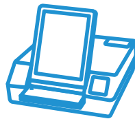
Marcador de boletas

Úselo como asistencia para marcar boletas